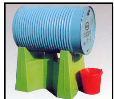
1x220l - 782x580x580 - LB SFA1 2x220l - 1245x585x388 - LB SFA2