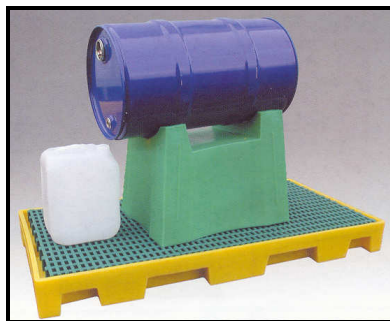
LB SFA 60 - 782x580x580mm